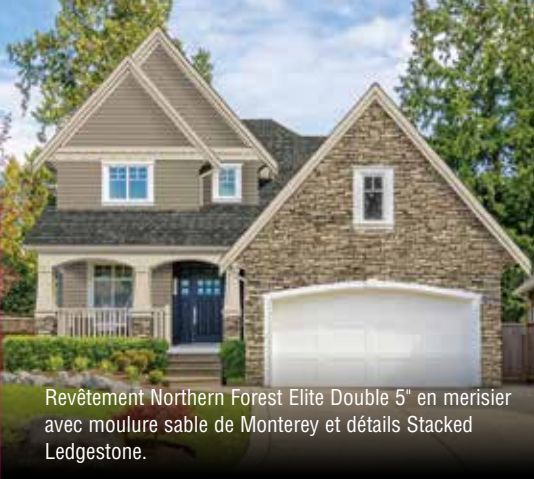
Revêtement Northern Forest Elite Double 5" en merisier avec moulure sable de Monterey et détails Stacked Ledgestone.