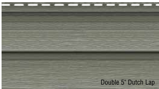
Double 5" Dutch Lap