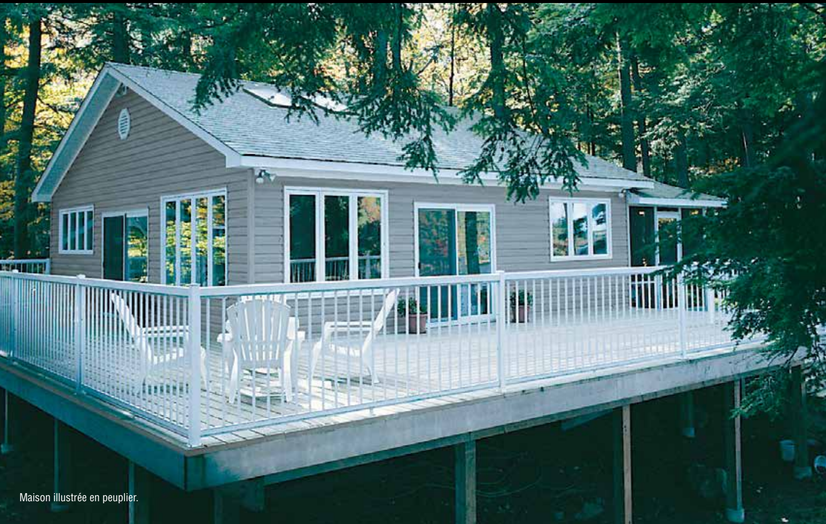
Maison illustrée en peuplier.

REVÊTEMENT EN VINYLE DE QUALITÉ ULTRA-SUPÉRIEURE