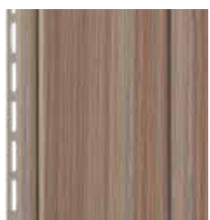
Vertical à baguette de 7"

Grâce à la technologie ChromaTrue® qui défie la décoloration, le Northern Forest Elite est offert dans des couleurs attrayantes aux teintes plus profondes et est couvert par une garantie à vie limitée contre la décoloration. Consultez la garantie écrite pour obtenir tous les renseignements. ChromaTrue®