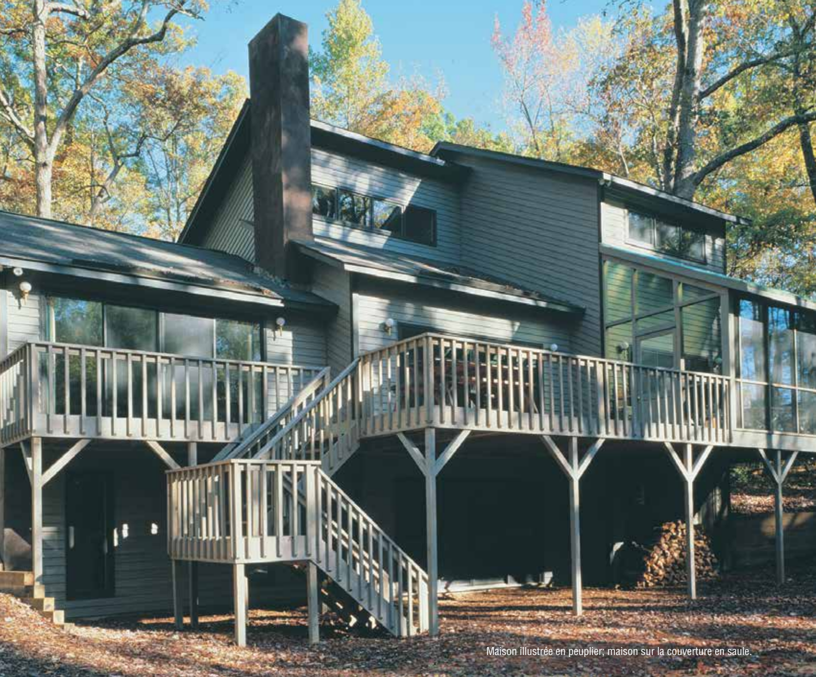
Maison illustrée en peuplier; maison sur la couverture en saule.