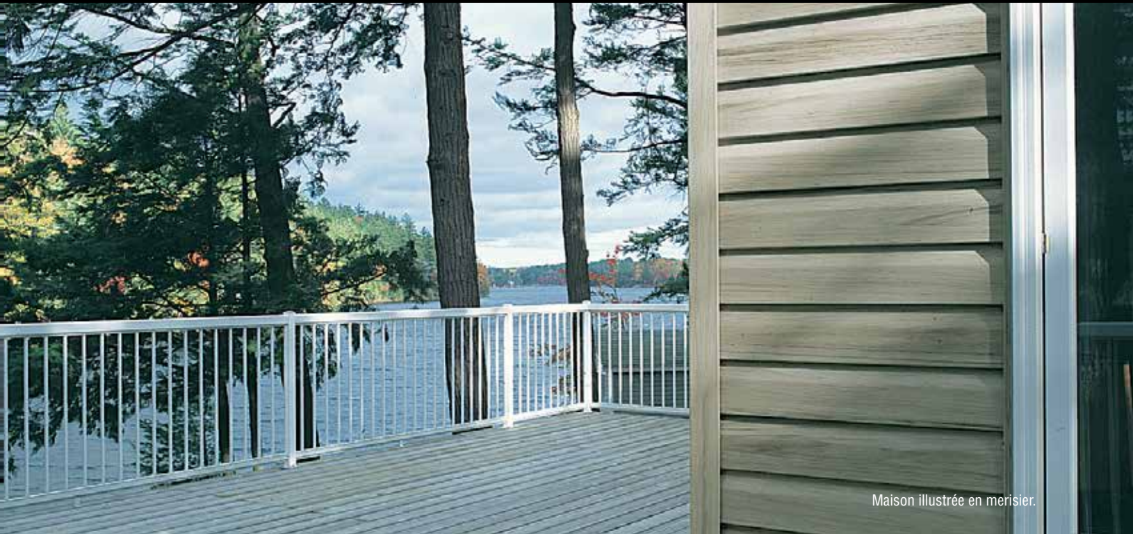
Maison illustrée en merisier.

Chez Gentek, chaque étape de la conception et du développement d'un produit est rigoureusement testée pour assurer une performance supérieure. Nous avons renforcé les brides de clouage et l'épaisseur des murs; nous avons aussi amélioré la conception des profils pour apporter une qualité, une valeur et un confort authentiques à chaque maison.