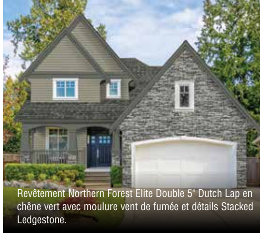
Revêtement Northern Forest Elite Double 5" Dutch Lap en chêne vert avec moulure vent de fumée et détails Stacked Ledgestone.