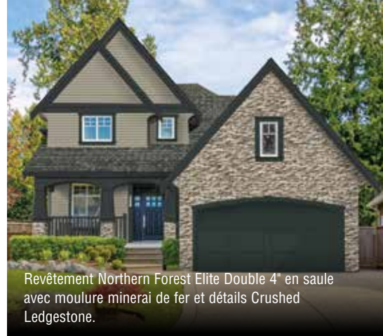
Revêtement Northern Forest Elite Double 4" en saule avec moulure minéral de fer et détails Crushed Ledgestone.